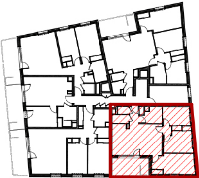
PLAN DE REPERAGE, Bâtiment B ech. 1/500