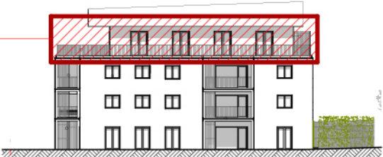
A ELEVATION SUD-EST ech. 1/500