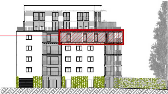
B ELEVATION NORD-OUEST ech. 1/500