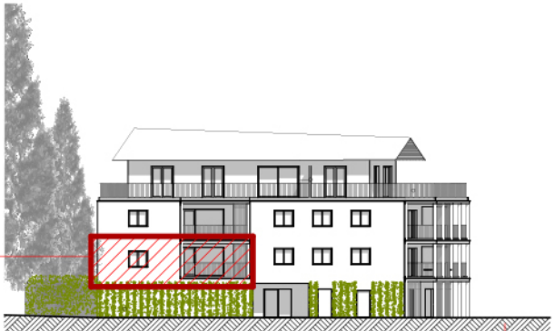
A ELEVATION NORD-OUEST ech. 1/500