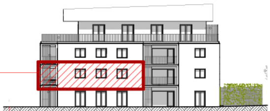
A ELEVATION SUD-EST ech. 1/500