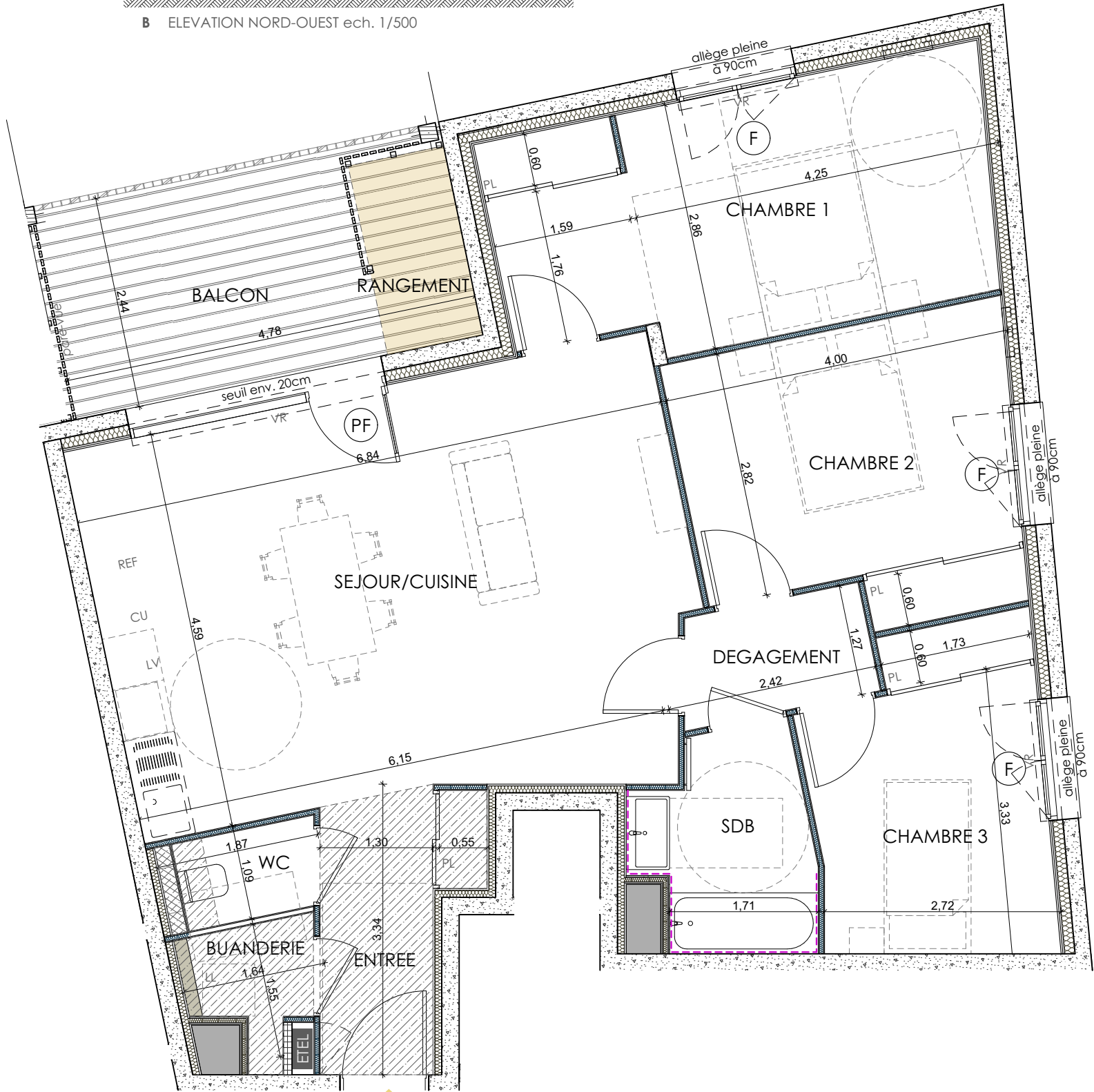
B404 - T4