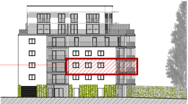
B ELEVATION NORD-OUEST ech. 1/500