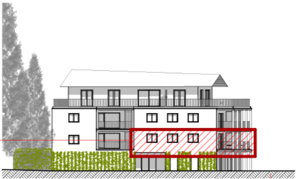
A ELEVATION NORD-OUEST ech. 1/500