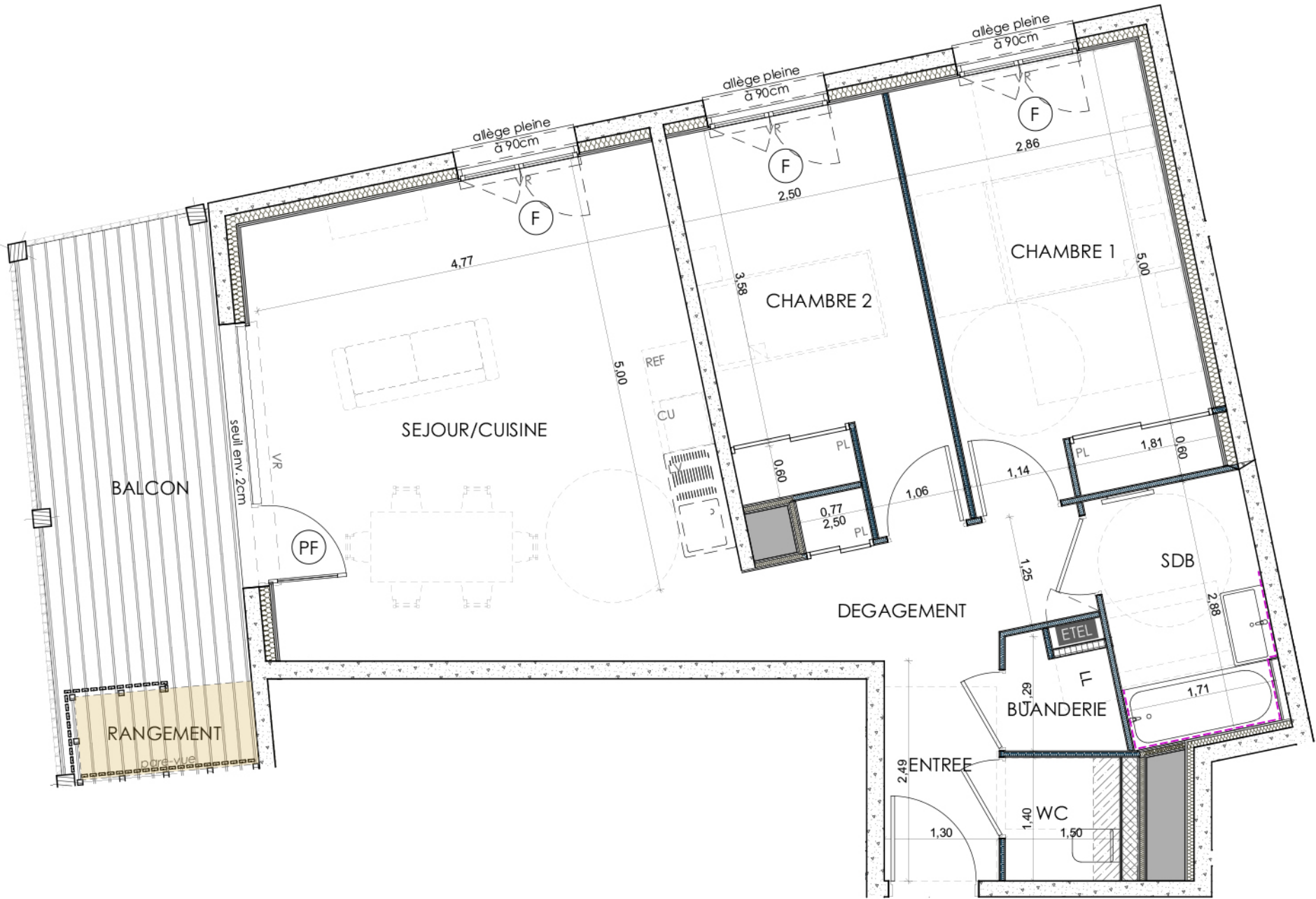
B104 - T3