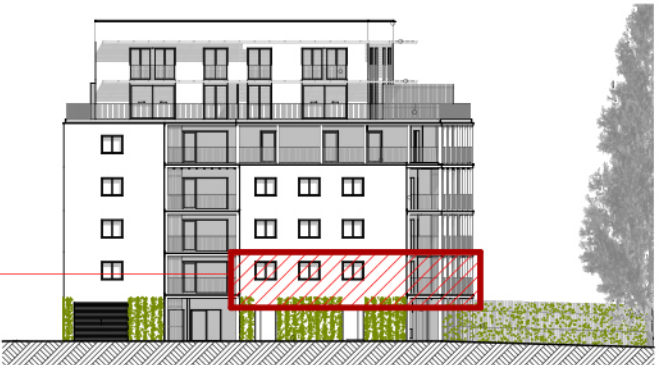
B ELEVATION NORD-OUEST ech. 1/500