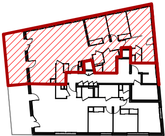
PLAN DE REPERAGE, Bâtiment B ech. 1/500