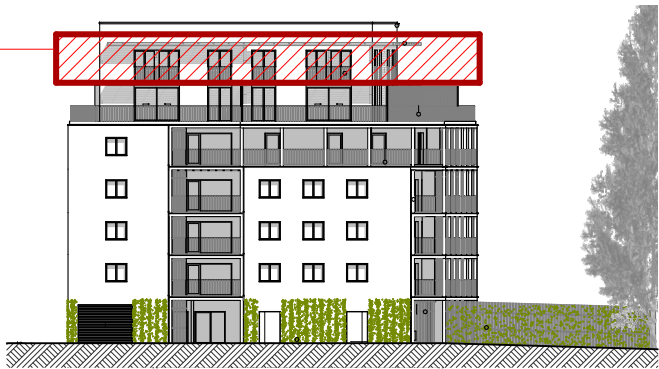
B ELEVATION NORD-OUEST ech. 1/500