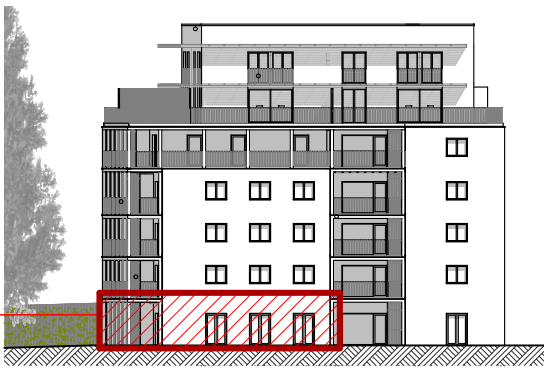
B ELEVATION SUD-EST ech. 1/500