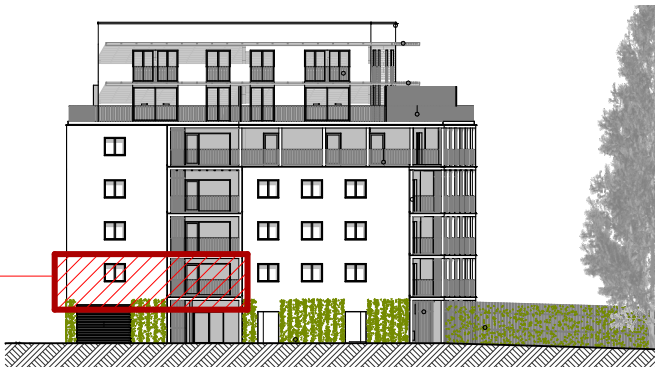
B ELEVATION NORD-OUEST ech. 1/500