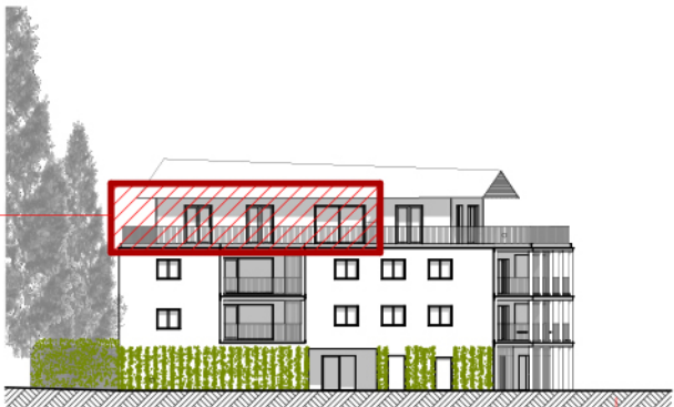
A ELEVATION NORD-OUEST ech. 1/500