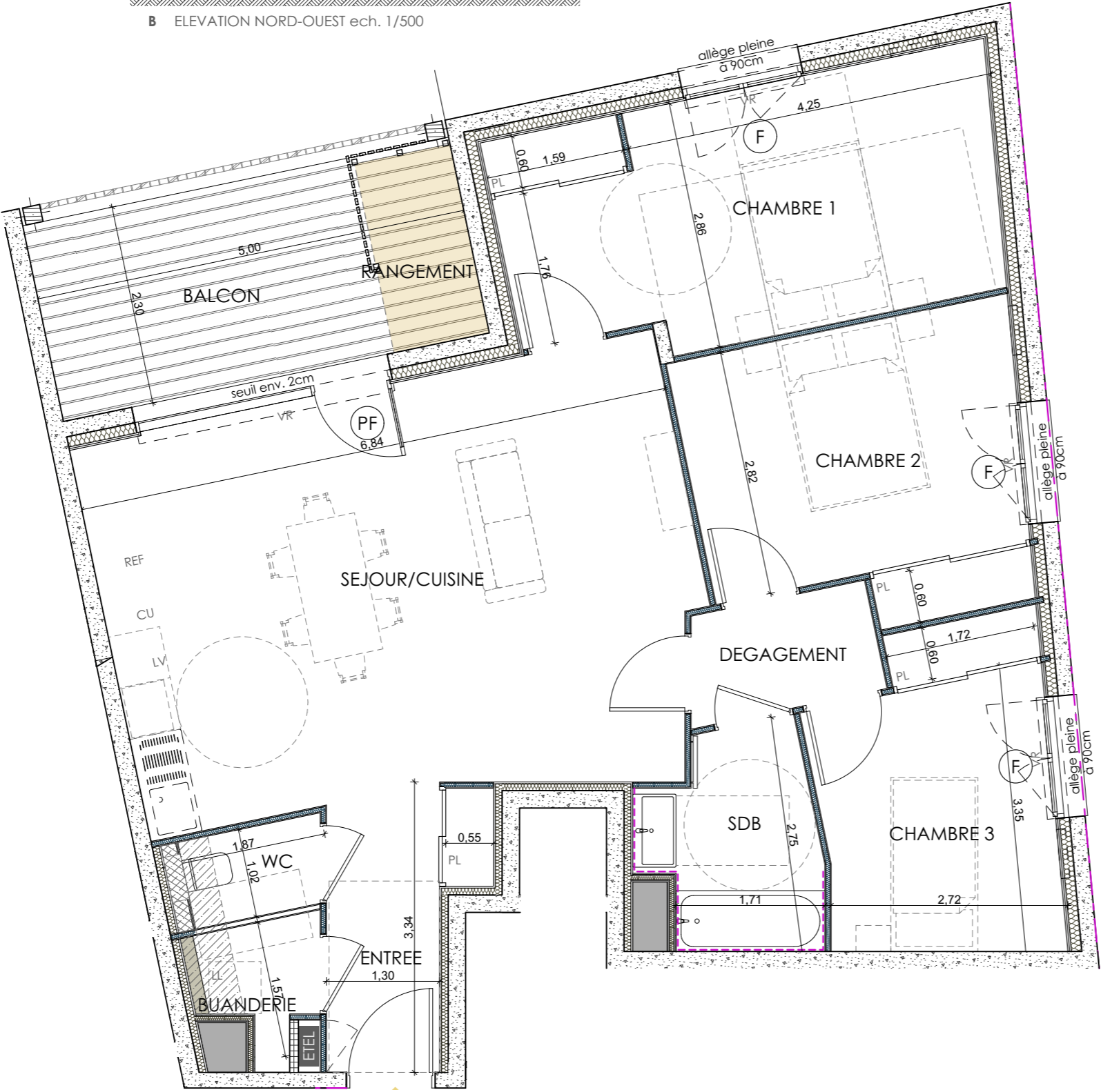
B205 - T4