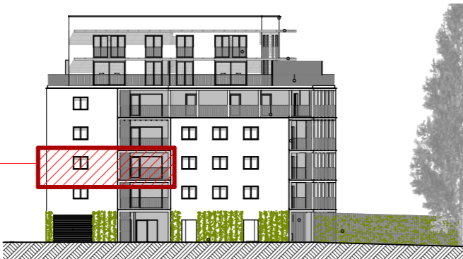
B ELEVATION NORD-OUEST ech. 1/500